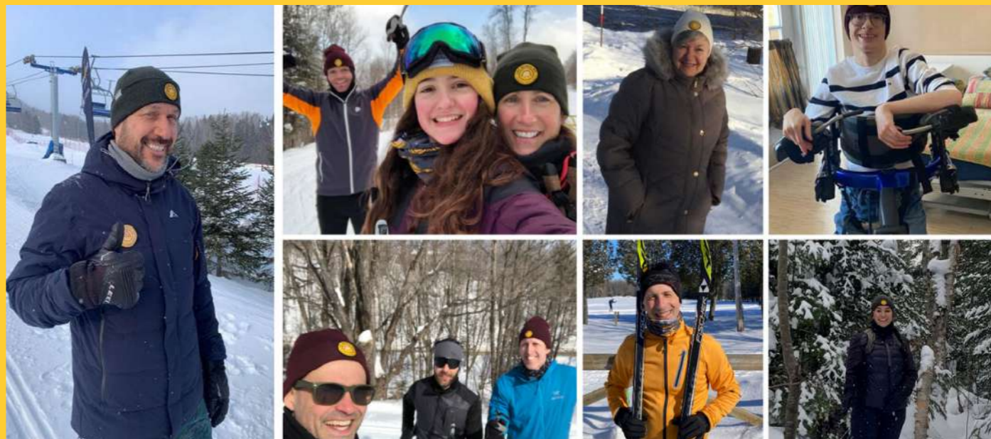
Photos de Martin Matte et de participants de l'édition 2021