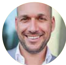
Martin Matte Fondateur et porte-parole Humoriste, acteur, auteur, scénariste et producteur