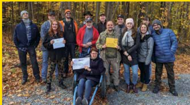
Camp de répit de l'Association des traumatisés cranio-cérébraux de la Montérégie

Association des personnes handicapées physiques et sensorielles / secteur Joliette Avec le soutien de la Fondation Martin-Matte, 21 personnes vivant avec un traumatisme crânien ont pu vivre un séjour de ressourcement dans une base de plein air de Lanaudière. Plusieurs activités, dont le tir à l'arc, étaient au programme, le tout dans un environnement sécuritaire et convivial. Ces escapades permettent aux participants de se retrouver et de tisser des liens pendant que leurs familles profitent d'une pause bien méritée.