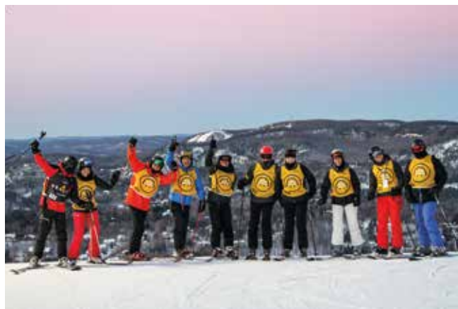
Les beaux 4h Fondation Martin-Matte

Nous tenons à remercier les présentateurs officiels de la soirée, Ameublements Tanguay et Desjardins, le partenaire du cocktail, Maxi, ainsi que les partenaires du cadeau, la Fondation St-Hubert et le Groupe Martin.