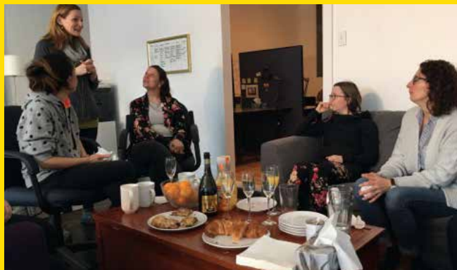
Matinée mamans de L'Étoile de Pacho