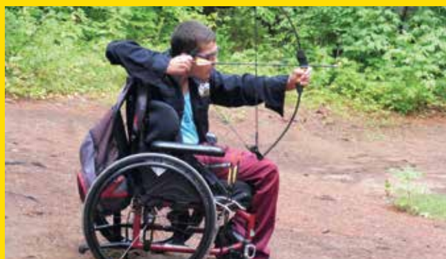
Association des personnes handicapées physiques et sensorielles / secteur Joliette Camp de répit dans la région de Lanaudière