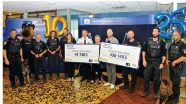
Remise de chèques du Service de police de Laval