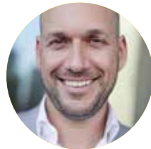
Martin Matte Fondateur et porte-parole Humoriste, acteur, auteur, scénariste et producteur