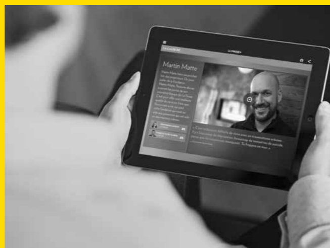
Reportage dans La Presse+

La Presse+ a fait un reportage dans lequel Martin Matte parle de sa Fondation ainsi que des Maisons Martin-Matte. On y retrouve également un témoignage très touchant de son frère Christian et de sa mère. Une partie du tournage s'est fait lors de la première édition de l'événement Les beaux 4 h et plusieurs images de l'événement y sont présentées. La vidéo de sept minutes montre les réalisations de la Fondation ainsi que le rôle important qu'elle joue dans la vie des personnes vivant avec un traumatisme crânien et celle de leurs familles. Parue dans l'édition de La Presse+ du 6 février 2016, la vidéo a été partagée sur la page Facebook de la Fondation Martin-Matte (20 069 amis) et celle de Martin Matte (710 585 fans). La vidéo a été vue par 2 195 089 personnes sur Facebook.