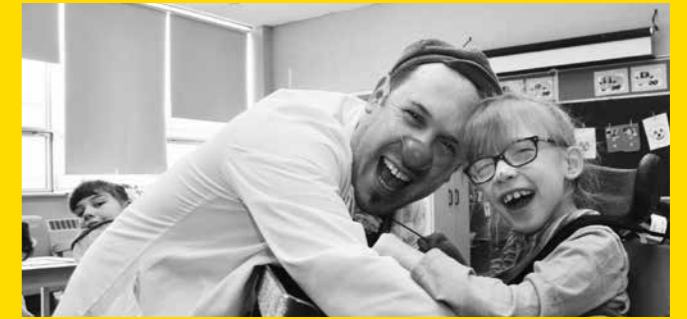
Fondation Jovia — Dr Clown à l'école Victor-Doré

Fondation Jovia — La Fondation Martin-Matte a contribué à l'implantation d'un nouveau programme Dr Clown à l'école Victor-Doré. Cette école spécialisée de niveau préscolaire et primaire a pu compter sur les visites de clowns thérapeutiques pour ses élèves présentant une déficience motrice ou organique grave. La présence de clowns en milieu d'apprentissage est très bénéfique pour les enfants. Par leur entrain et leur bonne humeur, les clowns aident les enfants à diminuer leur stress et leur anxiété, tout en ajoutant un brin de folie à leur quotidien.