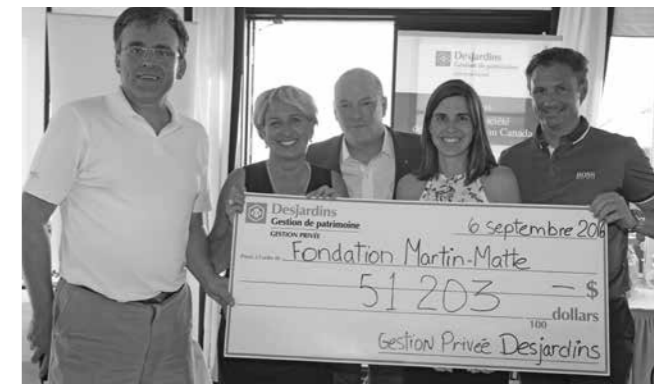
Gestion privée Desjardins

Les employés de la Banque Nationale, au Commerce international secteur Import-Export, ont porté leurs jeans un jeudi sur deux en échange d'un don à la Fondation Martin-Matte. Ils ont ainsi cumulé plus de 13 850 $ en sept ans et demi pour les projets de la Fondation. Un grand merci à tous les membres de l'équipe Import-Export pour leur soutien et leur fidélité!