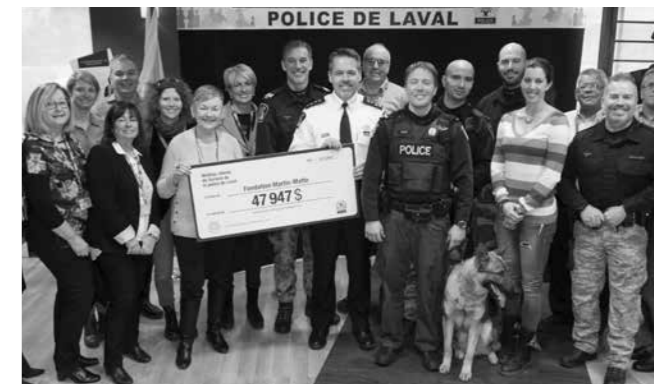
L'équipe des maîtres-chiens du département de police de Laval