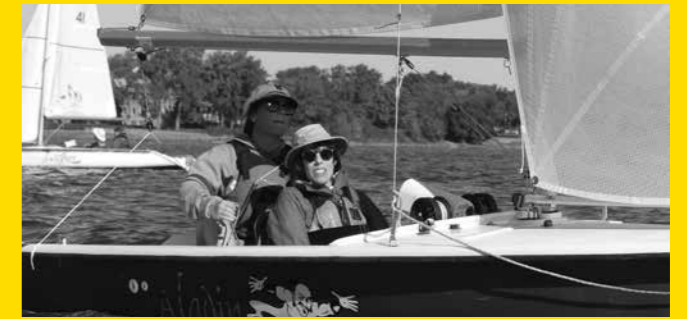
Association québécoise de voile adaptée

Association québécoise de voile adaptée (AQVA) — La Fondation a financé le remplacement de plusieurs installations et équipements désuets afin de mieux répondre aux besoins des membres. Grâce à cette contribution, des enfants et des adultes atteints d'une incapacité physique ou sensorielle ont pu bénéficier d'une nouvelle rampe d'accès au quai, de deux nouveaux lève-personnes électriques ainsi que d'une nouvelle salle de bain avec lève-personne sur rail et table de changement.