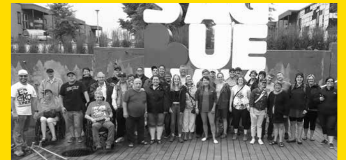
Trois associations se regroupent pour un camp de répit

La Fondation est fière d'avoir permis à trois associations pour personnes victimes d'un TCC de se regrouper pour faire un séjour de camp de répit au Saguenay-Lac-Saint-Jean.