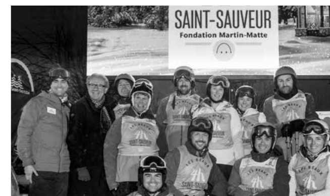
Les ambassadeurs de l'événement Les beaux 4 h