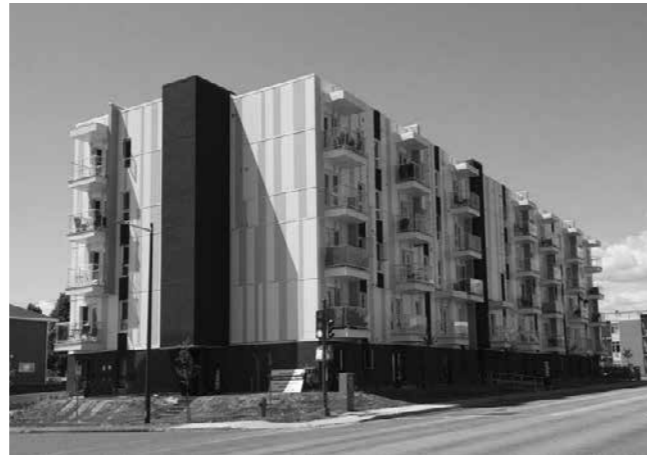
La Maison Martin-Matte de Québec

En 2016, ce sont plus de 550 000 $ qui ont été redistribués dans les projets des Maisons Martin-Matte et auprès d'organismes offrant des activités de loisirs et du répit aux familles.