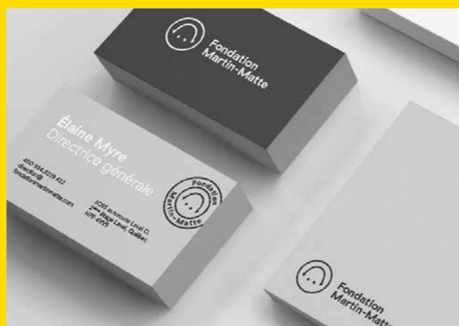
Notre nouvelle signature

À l'aube de ses 10 ans, la Fondation Martin-Matte a décidé d'actualiser sa signature et son image de marque. Cela a été possible grâce à sa nouvelle agence publicitaire Ig2. Un grand merci à l'extraordinaire équipe de Ig2 qui a actualisé le logo de la Fondation et a créé un sceau. Nous aimerions également souligner le travail exceptionnel de l'agence DentsuBos qui soutient la Fondation depuis ses débuts. Merci pour le talent et la fidélité de l'équipe !