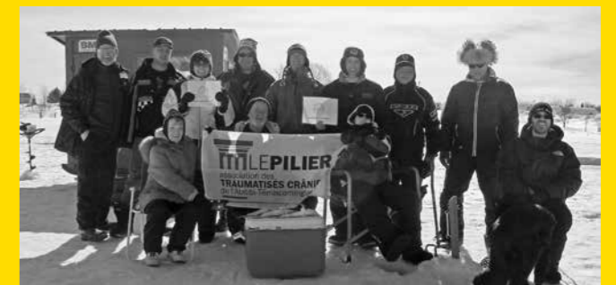
Des activités de plein air pour l'Association Le Pilier

Le Pilier, Association des traumatisés crâniens de l'Abitibi-Témiscamingue — La Fondation a permis à 15 membres de l'Association de participer à une activité de plein air de 2 jours, dans la ville de Val-d'Or. Les participants ont pu faire du patin, une promenade en forêt ainsi que de la pêche sur glace.